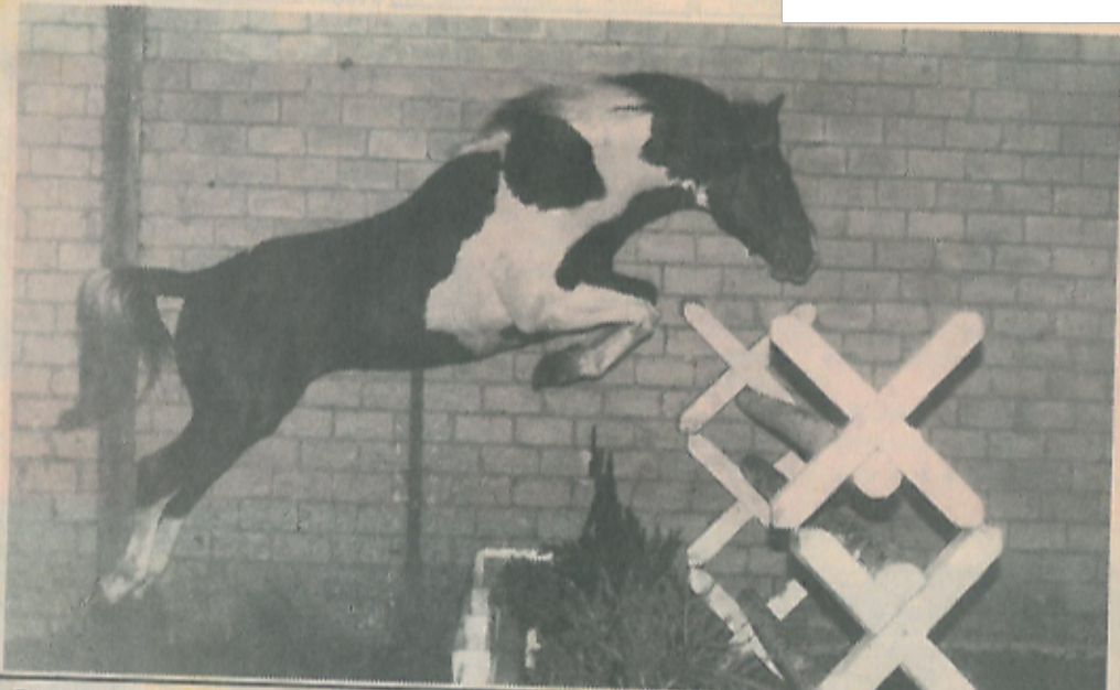
Besonders die Sprunggewalt von „Welcome Ippe 787“ begeistert die Pintoliebhaber aus dem gesamten Bundesgebiet.

aber auch ein optimales Turnierpferd, das nach einer guten Ausbildung seinem Reiter bestimmt viel Freude machen wird.